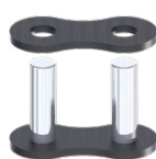
Maillon à river RÉF : 005