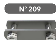
Eslabón de unión con tuercas