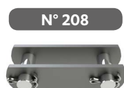
Eslabón de unión con pasadores