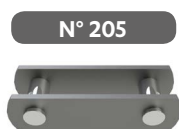
Eslabón exterior para remachar